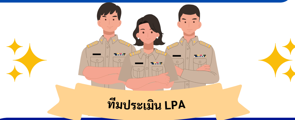
ทีมประเมิน LPA

หมายเหตุ : ถ้า อปท. ยืนยันข้อมูลในระบบเสร็จสิ้นเรียบร้อยแล้ว ทีมประเมินสามารถเข้าประเมินได้